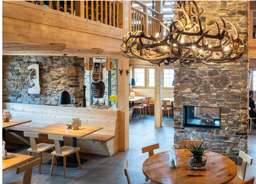
Chaque invité le remarque immédiatement: le grand lustre en bois de cerf.